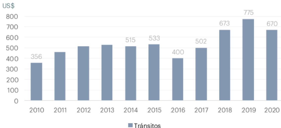
Figura 2. Tránsitos y exportaciones de productos farmacéuticos (2010-2020) por Uruguay XXI (2021).

En el año 2020, los procedimientos de tránsitos se agruparon en 10 empresas que comprendieron más del 98% operacional, tales como Adium Pharma, AstraZeneca y Sanofi. De igual forma, la existencia de una extensa participación de las exportaciones se concentra en mercancías terminadas, mientras que solo 3% perteneció a materia prima para la producción de medicamentos, porque son ilusorios los tránsitos de productos veterinarios, incumbiendo toda transacción para el uso humano.